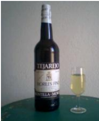
Vino de Montilla