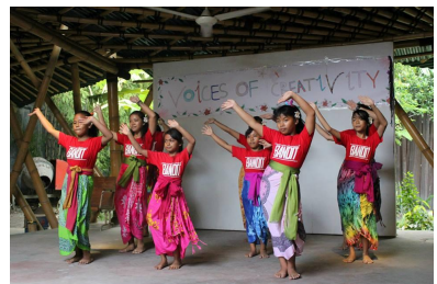
Concurso de creatividad, Bali

Les diría que desde que comencé a viajar me siento mucho más feliz. Tengo amigos por todas partes del mundo. He aprendido inglés, indonés, etc. He conocido muchas cosas preciosas y es una experiencia única que hace a la persona súper grande y súper interesante.